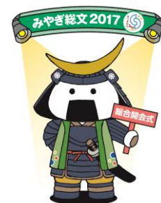
大会マスコットキャラクター むすび丸